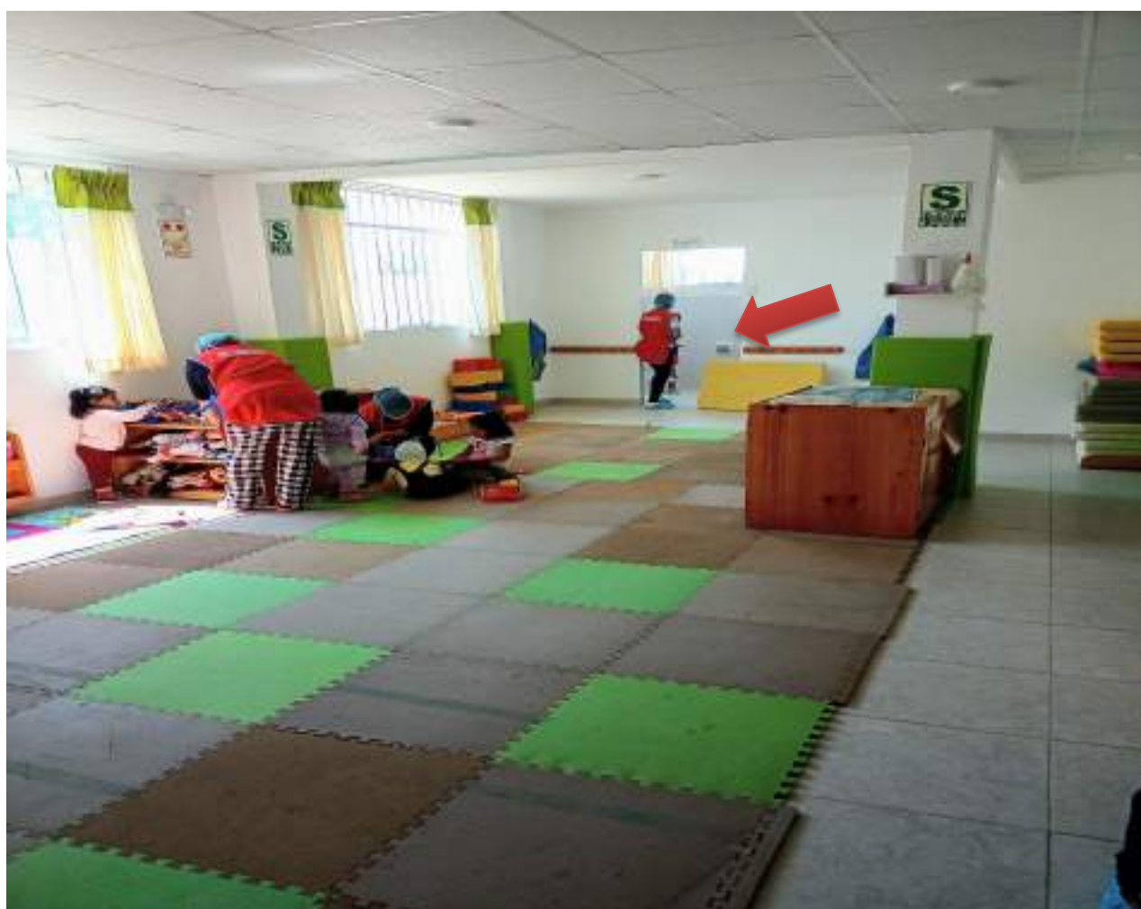
Fotografía de baños al interior de las salas de niños/as usuarios del servicio de Cuidado Diurno.