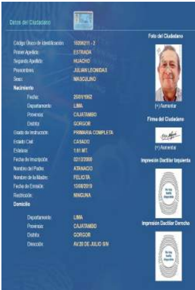
Anexo 01 Captura de pantalla de consulta al RENIEC