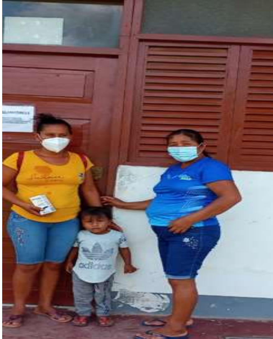
FOTO DE ENTREGA DEL SUPLEMENTO DE HIERRO EN EL PUESTO DE SALUD