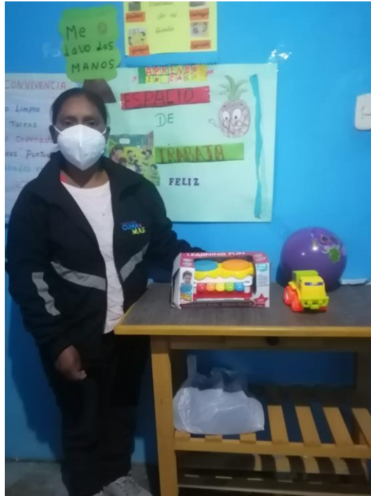
Recepción de material, por parte de la facilitadora.