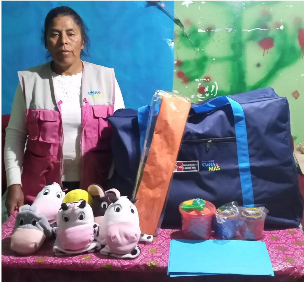
Se observa: Recepción de material por la facilitadora para la reposición del kit de facilitador.

"Decenio de la Igualdad de Oportunidades para Mujeres y Hombres" "Año de la unidad, la paz y el desarrollo"