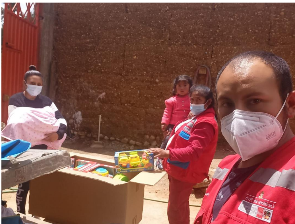
Recepción, verificación y modulado de material para el kit de facilitadora, por parte de la tesorera del comité.

"Decenio de la Igualdad de Oportunidades para Mujeres y Hombres" "Año de la unidad, la paz y el desarrollo"