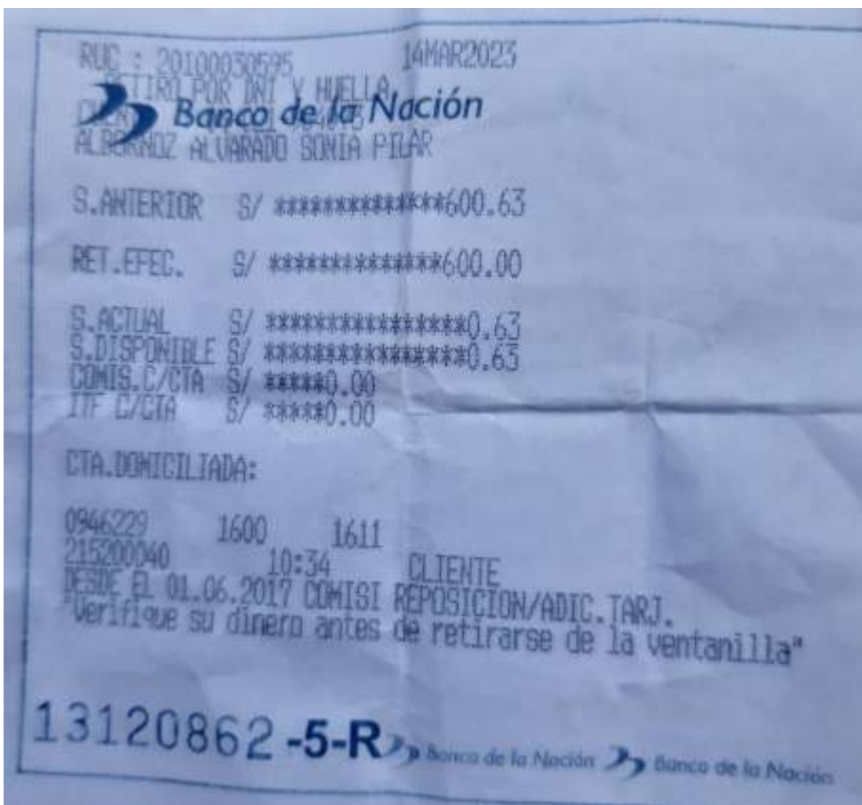
Anexo 03: Baucher de retiro de pension (01 folio)