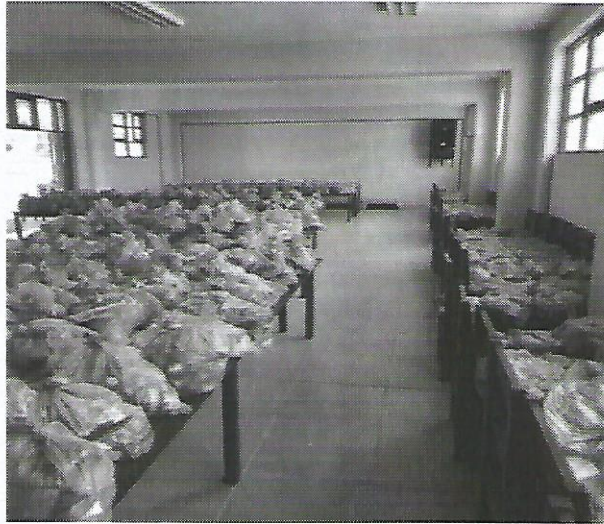
Distribución de alimentos de la primera entrega del CAE de la IE Manuel A Odria