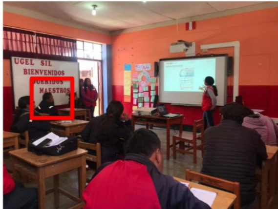
ANEXO 2: LISTA DE ASISTENCIA A CAPACITACIÓN FECHA 28/04/2023