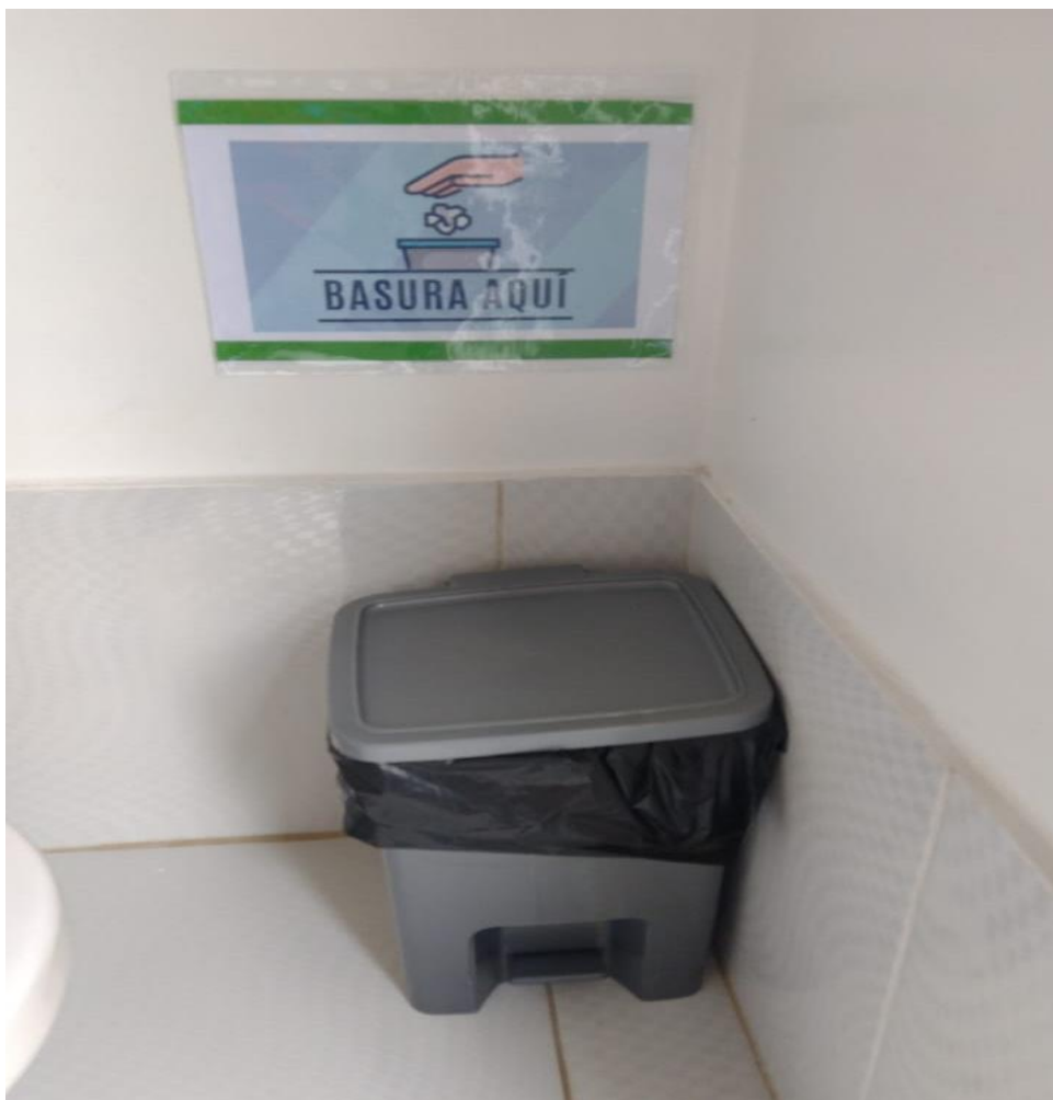
FOTO DE TACHO DE BASURA CON BOLSA Y TAPA.

Av. Arequipa 2637. San Isidro, Lima - Perú Central telefónica: (51-1) 748-2000 www.cunamas.gob.pe