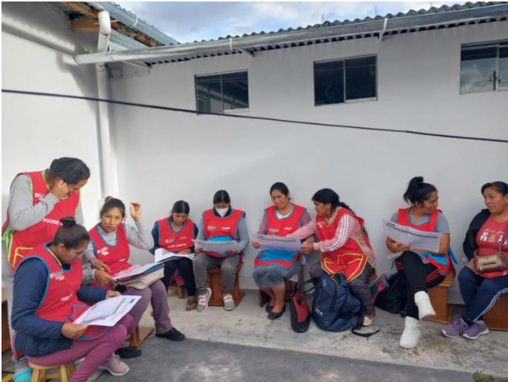
FOTO DE REUNIÓN CON ACTORAS COMUNALES PARA FORTALECIMIENTO EN REGISTRO DEL PLAN DE EXPERIENCIAS.