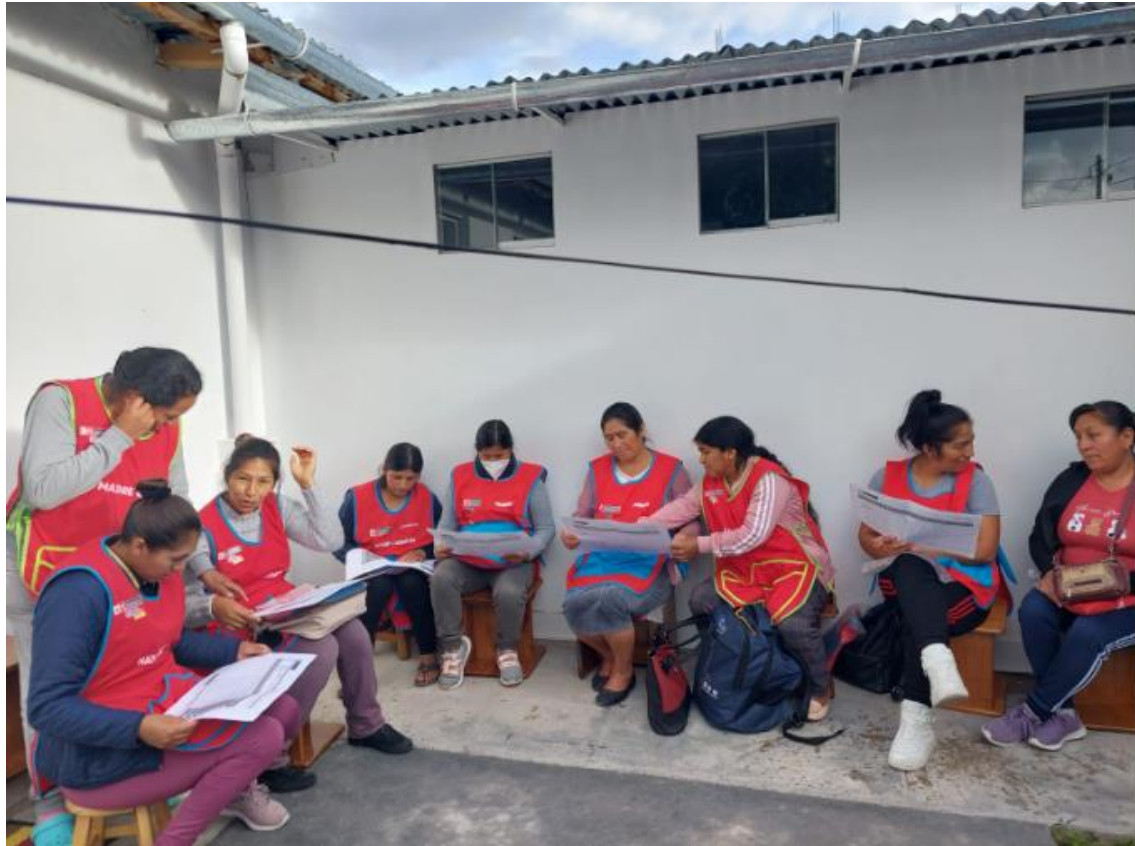
FOTO DE REUNIÓN DE FORTALECIMIENTO A LAS MADRES CUIDADORAS Y MADRES GUÍAS.

Av. Arequipa 2637. San Isidro, Lima - Perú Central telefónica: (51-1) 748-2000 www.cunamas.gob.pe