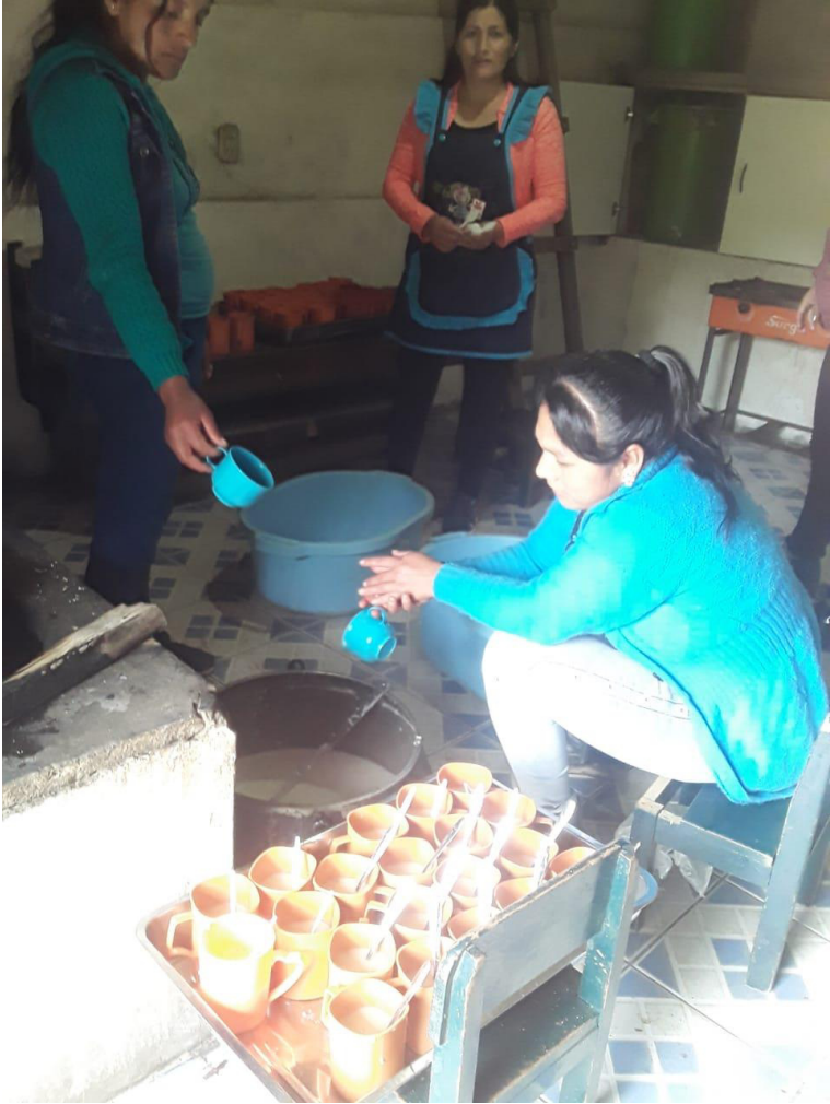
Anexo N° 03: Fotografía 1: Preparacion y servido de los alimentos