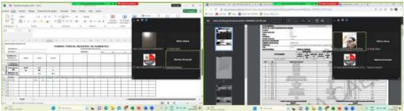
ANEXO N° 02: Acta de asistencia técnica firmada por los miembros CAE.