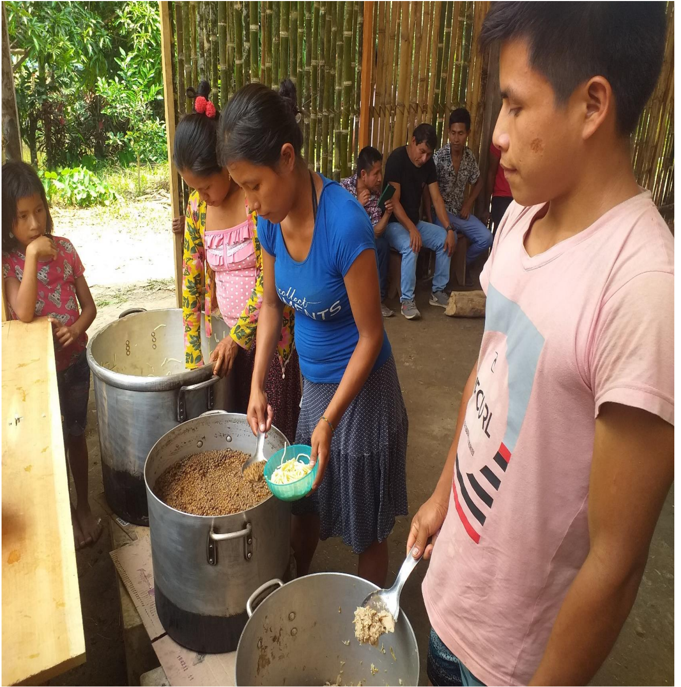
ANEXO 04: PERSONAL DE COCINA SIRVIENDO LOS ALIMENTOS