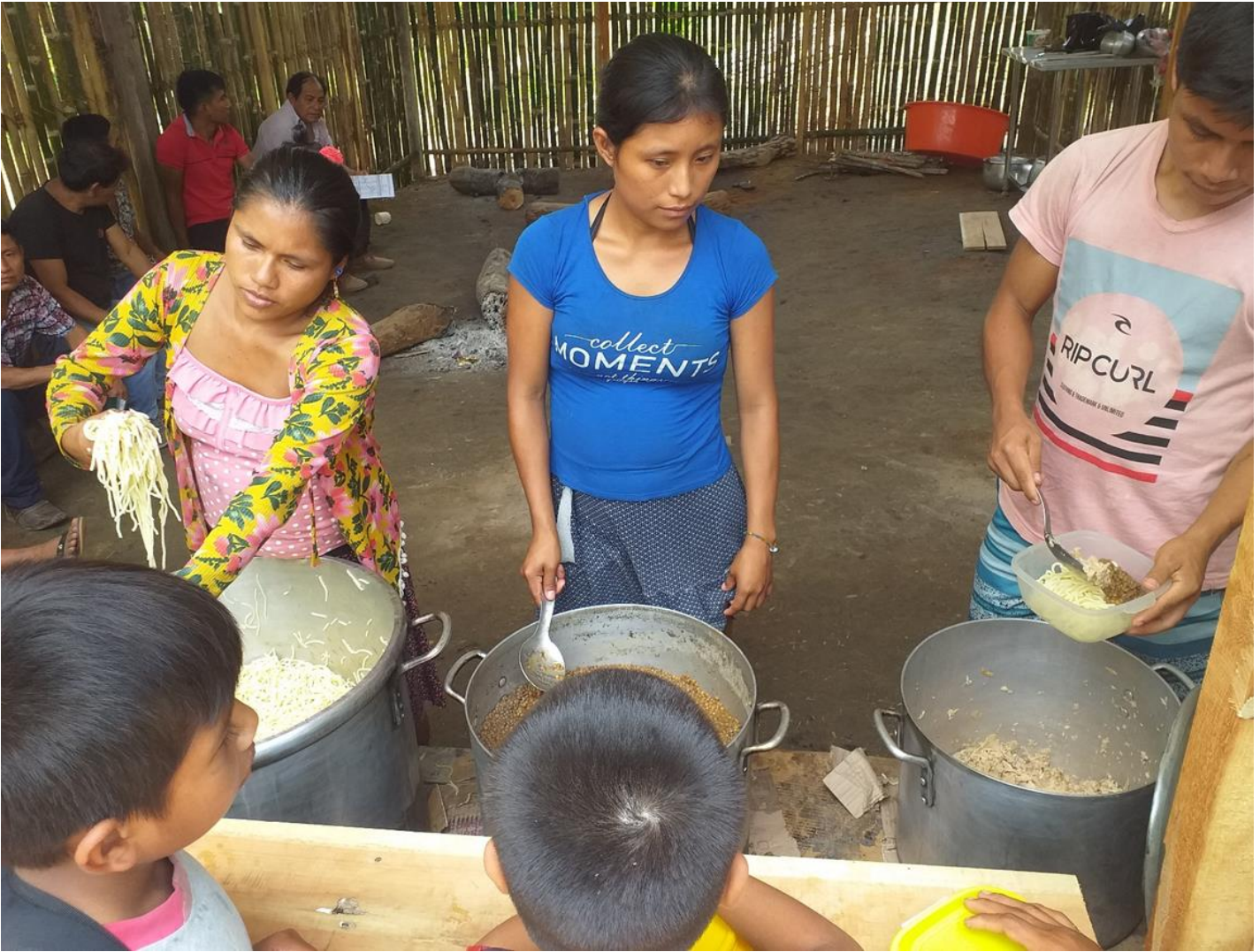
ANEXO 05: PERSONAL DE COCINA SIRVIENDO LOS ALIMENTOS