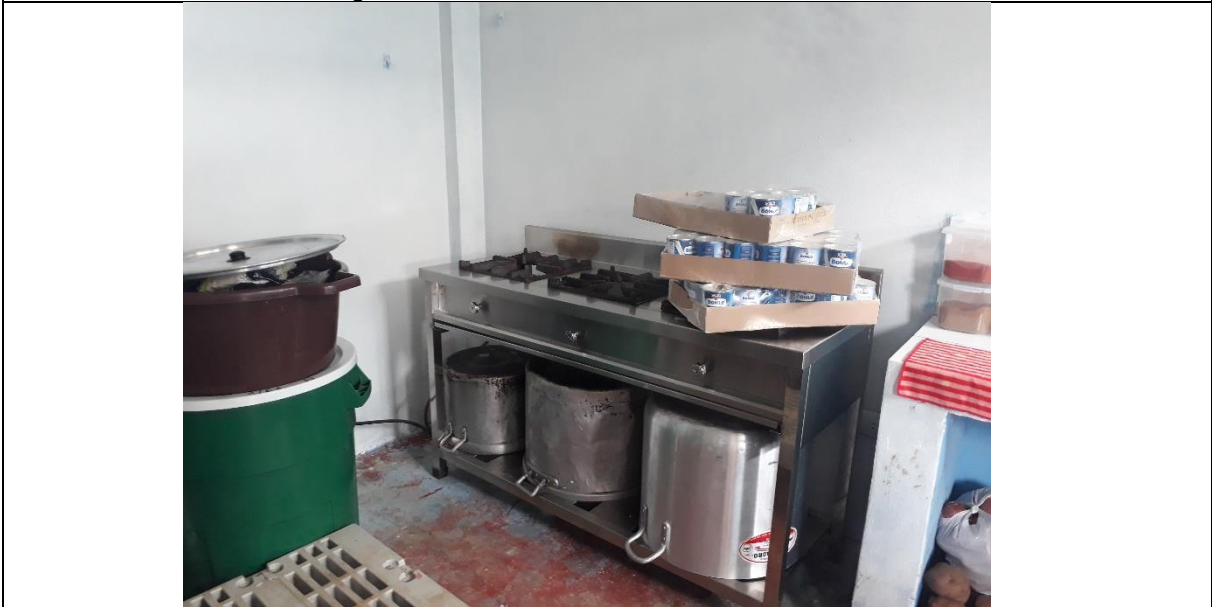
Fotografia 02: Verificacion de la cocina de la I.E