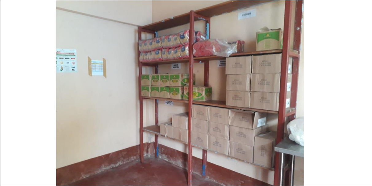
Fotografia 01: Verificacion de almacen de I.E.