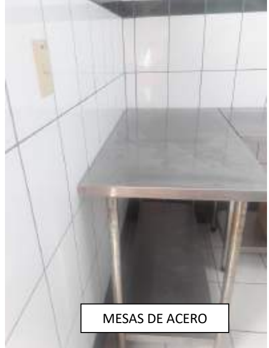
MESAS DE ACERO