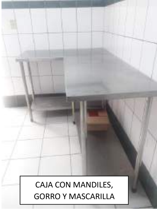
CAJA CON MANDILES, GORRO Y MASCARILLA