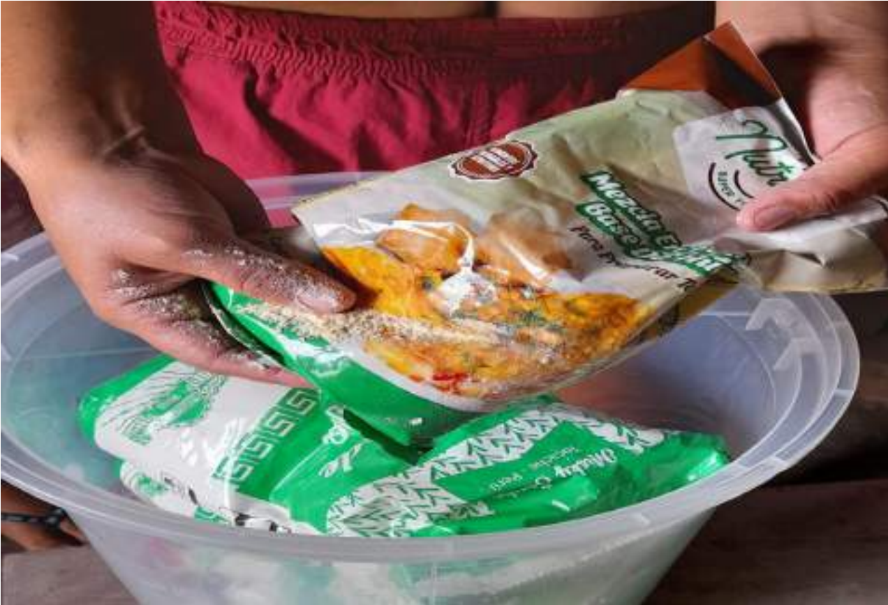
Captura fotográfica de los dos productos en mal estado.