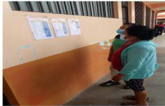
Imágenes 04 y 05: Aplicación de Ficha Seguimiento Remoto 2022