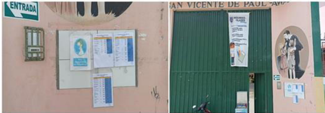
Imagen N° 01, 02 y 03: Evidencias de la colocacion en lugar visible de la IE y/o espacios de publicacion virtual la lista y cantidad de los alimentos que debe recibir cada alumno matriculado (Frontis y paredes exteriores de las aulas)

"Decenio de la Igualdad de Oportunidades para Mujeres y Hombres" "Año del Fortalecimiento de la Soberanía Nacional"