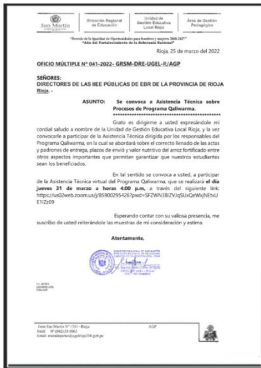
Imagen N° 08: Invitación Asistencia Técnica sobre proceso del Programa Qali Warma por parte de la UGEL- RIOJA

"Decenio de la Igualdad de Oportunidades para Mujeres y Hombres" "Año del Fortalecimiento de la Soberanía Nacional"