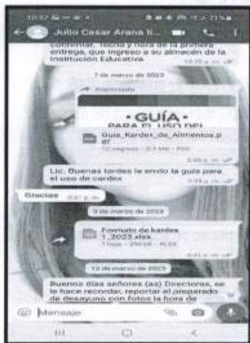
Pantallazo del envío del documento Kardex – IE 30941