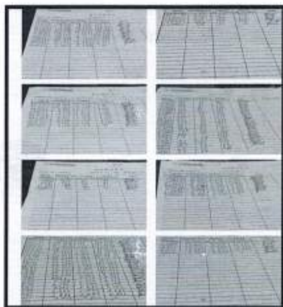
Documento Kardex actualizado IE 30941