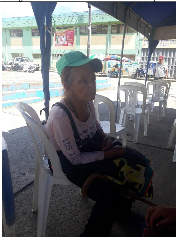
Fotografia 02: Adulta mayor en estado de abandono