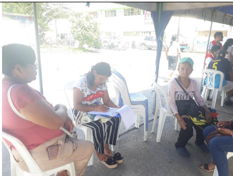
Fotografia 01: Ciudadana realizando su pedido