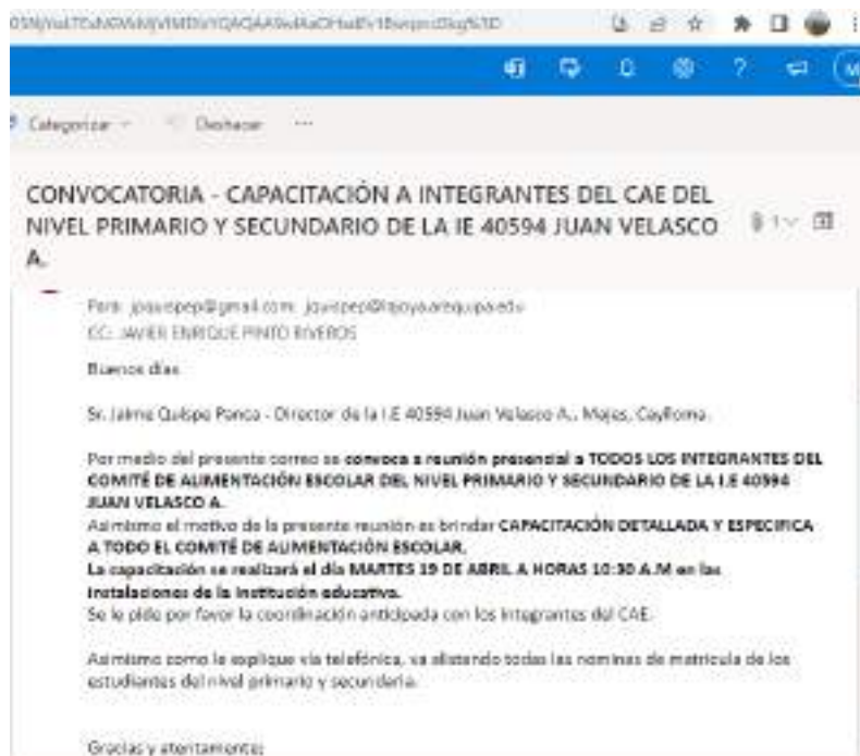
Imagen 2. Envío de correo electrónico al director de la IE 40594 Juan Velasco A.

4.3. El día 16 de abril del 2022 después de coordinar la fecha de capacitación, se envió al director de la IE un correo electrónico, donde se convoca a capacitación presencial a todos los integrantes del CAE, dicha capacitación se realizaría el día martes 19 de abril a horas 10.30 am.