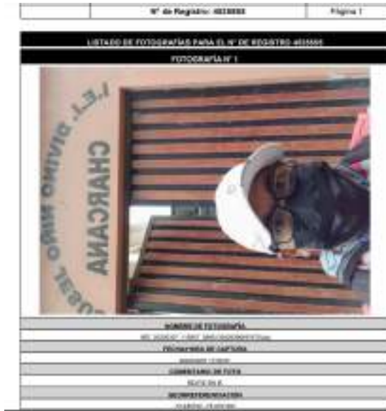
Foto. de la supervisión presencial en la fachada de la I.E.

Lo cual a la fecha la IEI. ya realizó la distribución de productos a los padres de familia, la primera entrega lo realizó el 13 de marzo y la segunda entrega el 20 de abril del presente año.