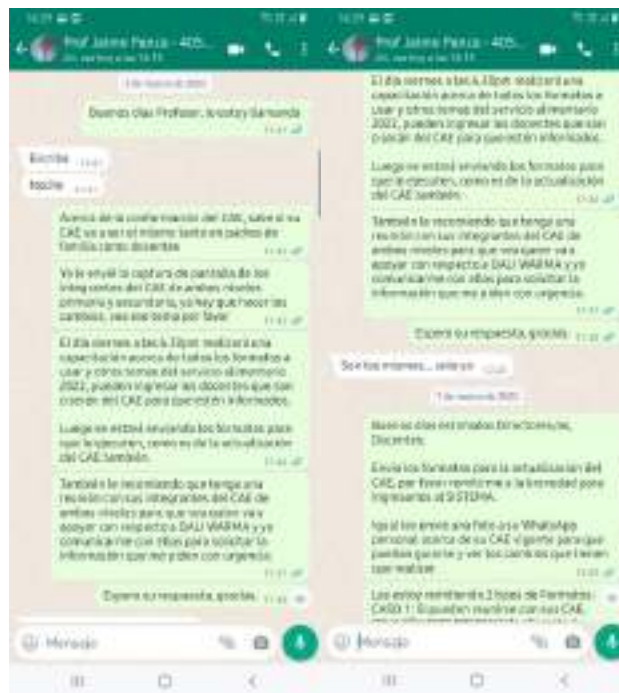
Imagen 1. Envío de fecha de capacitación virtual acerca del inicio del servicio alimentario 2022

4.3. El día 16 de abril del 2022 después de coordinar la fecha de capacitación, se envió al director de la IE un correo electrónico, donde se convoca a capacitación presencial a todos los integrantes del CAE, dicha capacitación se realizaría el día martes 19 de abril a horas 10.30 am.