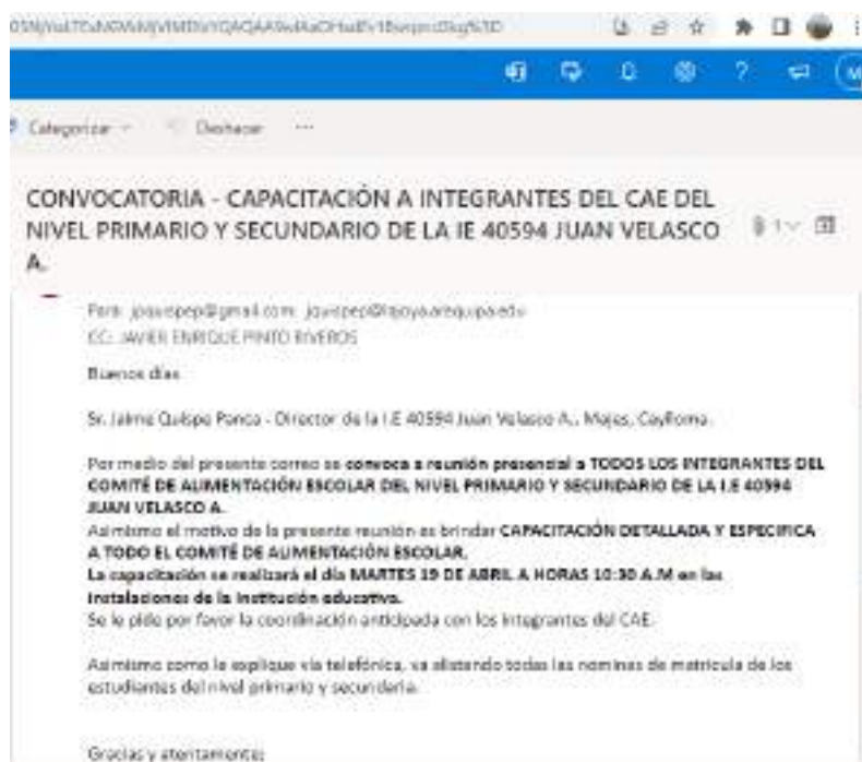
Imagen 2. Envío de correo electrónico al director de la IE 40594 Juan Velasco A.

4.3. El día 16 de abril del 2022 después de coordinar la fecha de capacitación, se envió al director de la IE un correo electrónico, donde se convoca a capacitación presencial a todos los integrantes del CAE, dicha capacitación se realizaría el día martes 19 de abril a horas 10.30 am.