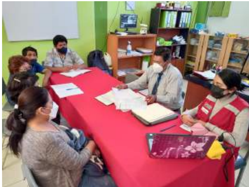
Imagen 3. Reunión de capacitación presencial realizada en la IE 40594 Juan Velasco A. del nivel primario