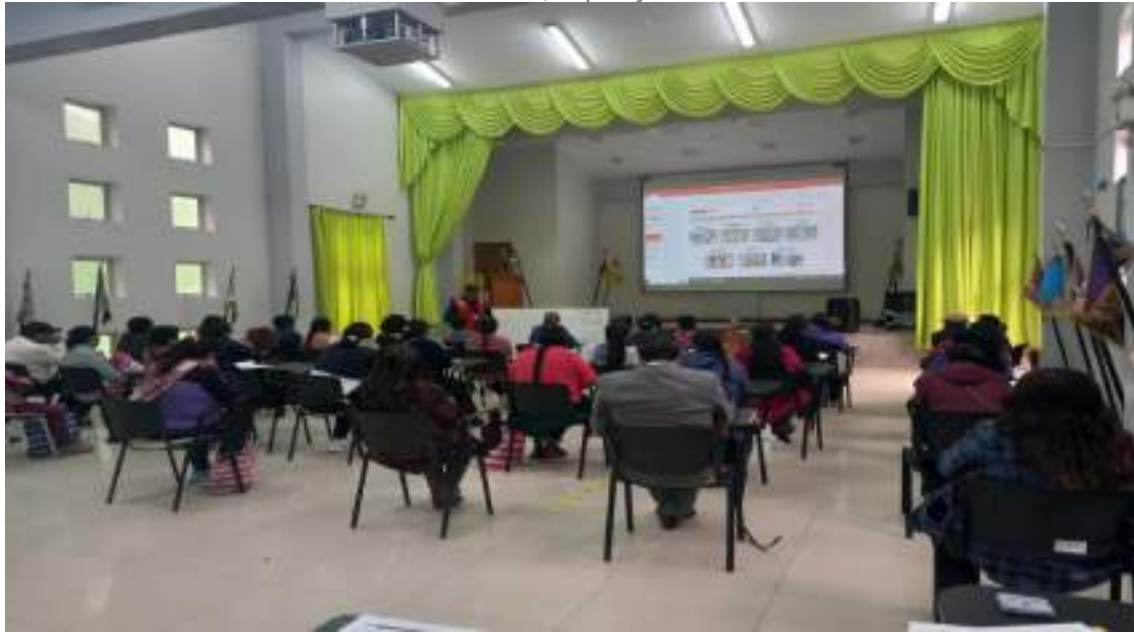
IMAGEN N° 10 CONTROL DE ASISTENCIA DE LA CAPACITACION

"Decenio de la Igualdad de Oportunidades para Mujeres y Hombres" "Año de la unidad, la paz y el desarrollo"