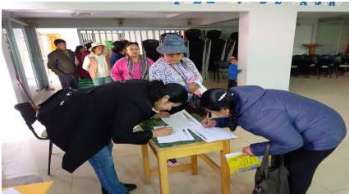
IMAGEN N° 09 CAPACITACION CENTRALIZADA Y SESION DEMOSTRATIVA