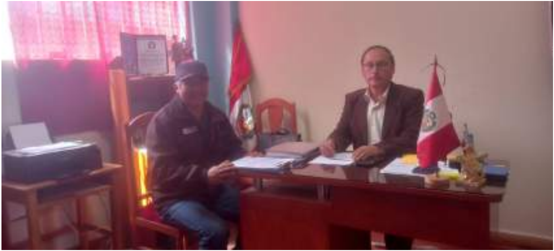
IMAGEN N° 05. REPORTE DEL SIAGIE AL 16/05/2023