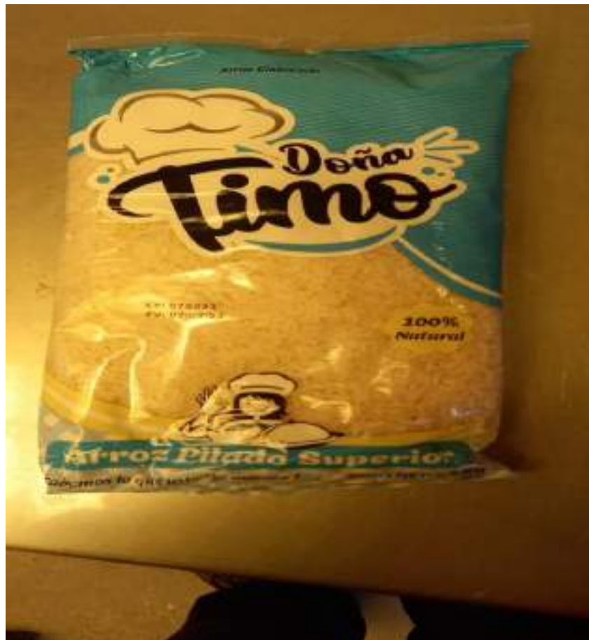
IMAGEN N° 12: PRODUCTO ARROZ DE MARCA DOÑA TIMO 2DA DOTACION