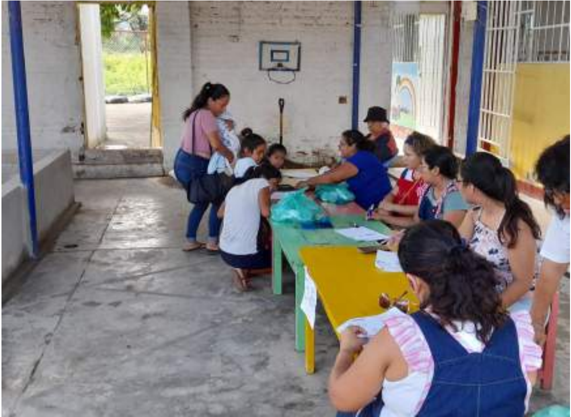
FOTOGRAFIAS DE LOS ALIMENTOS DEPOSITADOS EN EL SUELO (PISO)