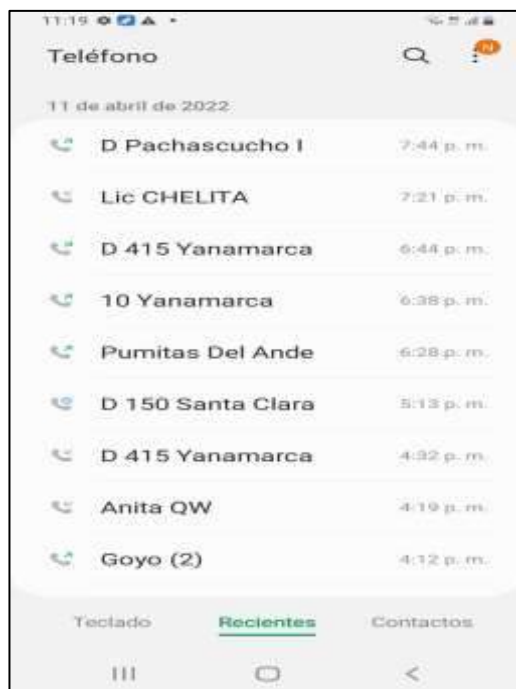
Imagen 1. Constatación del punto alertado.

Con fecha 11/04/ 2022 mediante mensaje de texto y llamada telefónica se realiza la constatación del punto alertado encontrando que la distribución de los alimentos correspondiente a la PRIMERA ENTREGA se realizó en la fecha 19/03/2022.