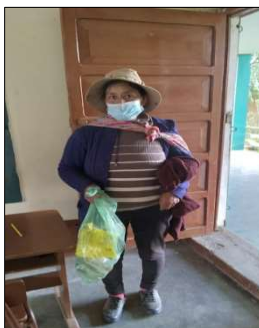
Imagen 2. Distribución de alimentos