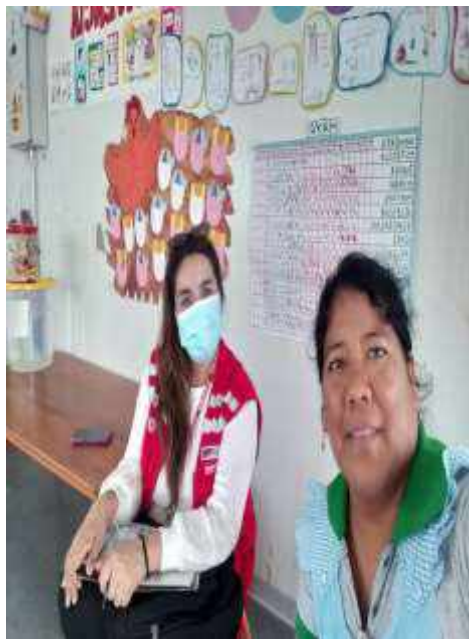
Asistencia técnica a la directora.