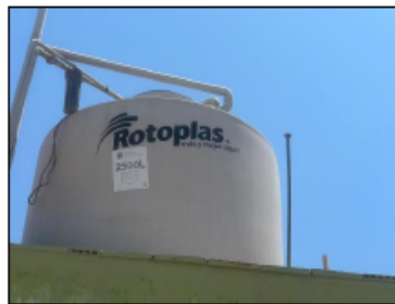
Imagen N°01: Tanque Elevado

En el CIAI NUEVO MORO, existe un tanque elevado de polietileno con una capacidad de almacenaje de 2500 L, el cual se encuentra en buen estado y operativo para realizar el suministro de agua durante todo el día. A fin de garantizar el abastecimiento de agua en el CIAI NUEVO MORO dentro del horario de atención a los niños.