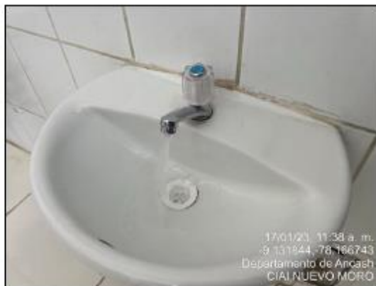
Imagen N°06: Abastecimiento de agua en grifos de SS.HH. Niños