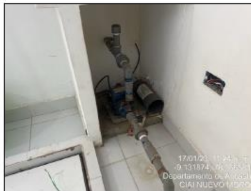
Imagen N°03: Electrobomba