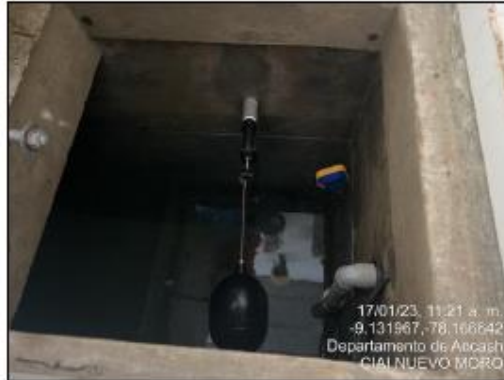
Imagen N°02: Tanque Cisterna

En el CIAI NUEVO MORO, existe un tanque cisterna de concreto con una capacidad de almacenaje de 2000 L, el cual se encuentra en buen estado y operativo, asimismo existe una electrobomba la cual realiza el bombeo del agua hacia el tanque elevado con la finalidad de garantizar el abastecimiento de agua en el CIAI NUEVO MORO.