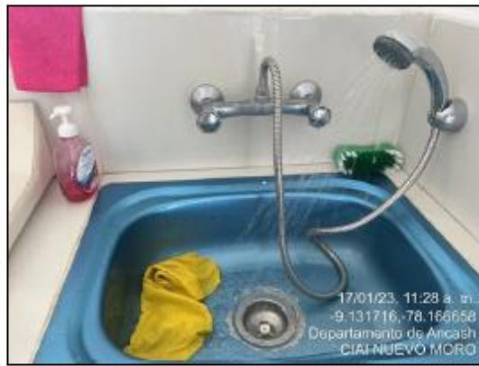
Imagen N°05: Abastecimiento de agua en grifos de pañalera