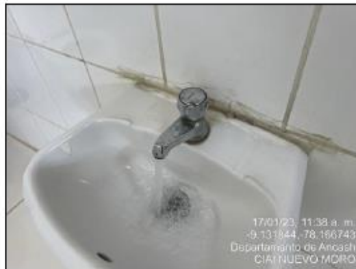
Imagen N°07: Abastecimiento de agua en grifos de SS.HH. Niños