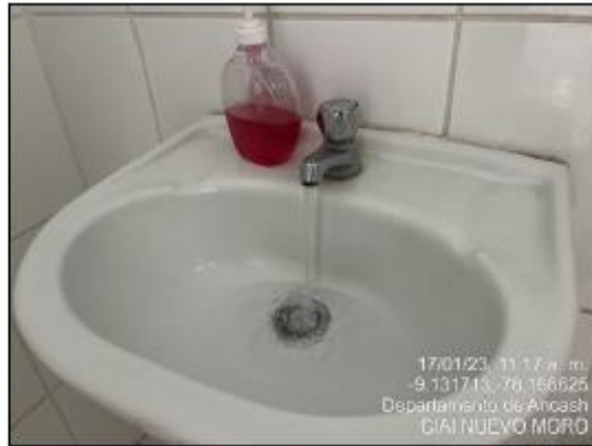
Imagen N°04: Abastecimiento de agua en grifos de SS.HH. Adultos