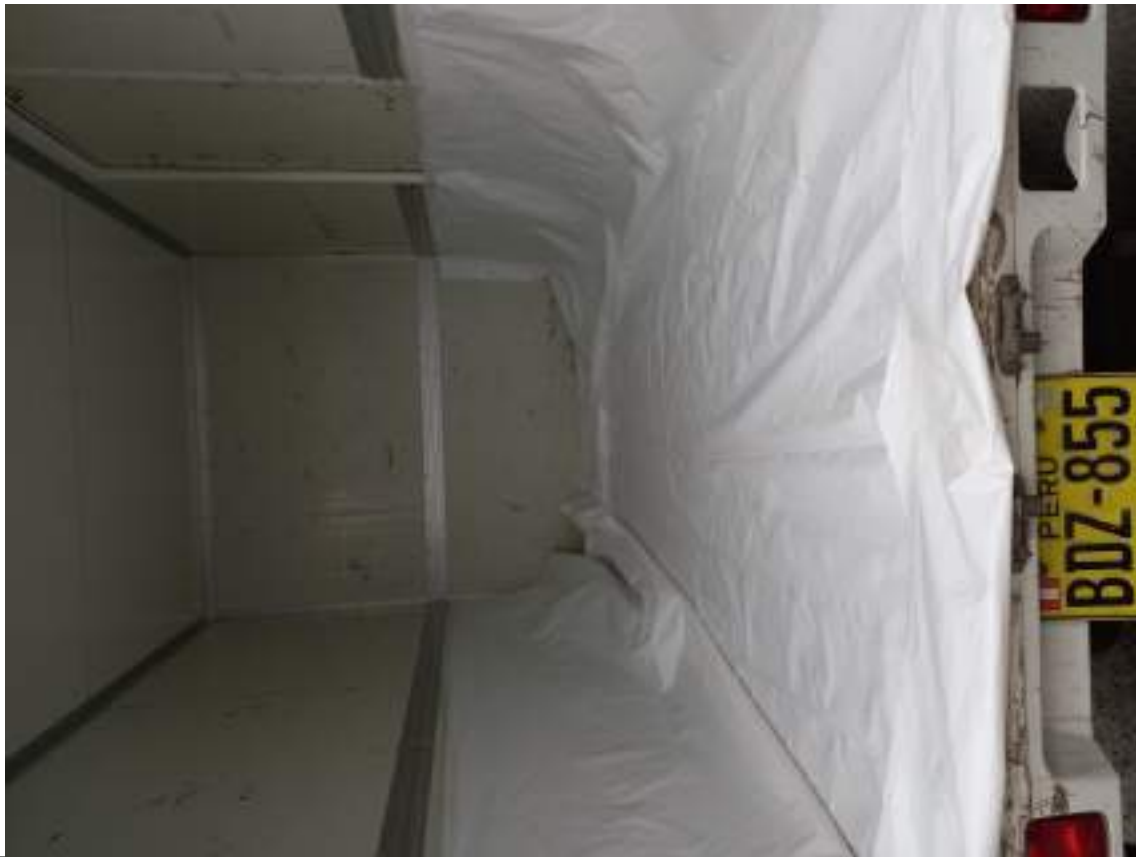
FOTOGRAFIA N°: 2