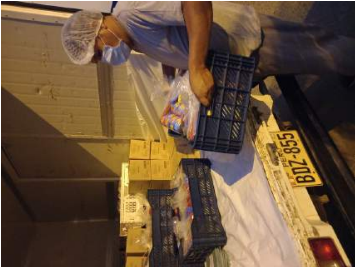
FOTOGRAFIA N°: 3