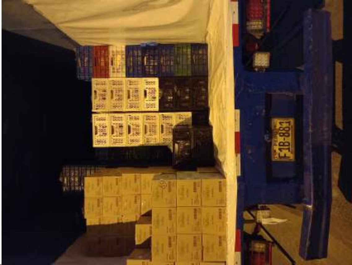
FOTOGRAFIA N°: 6