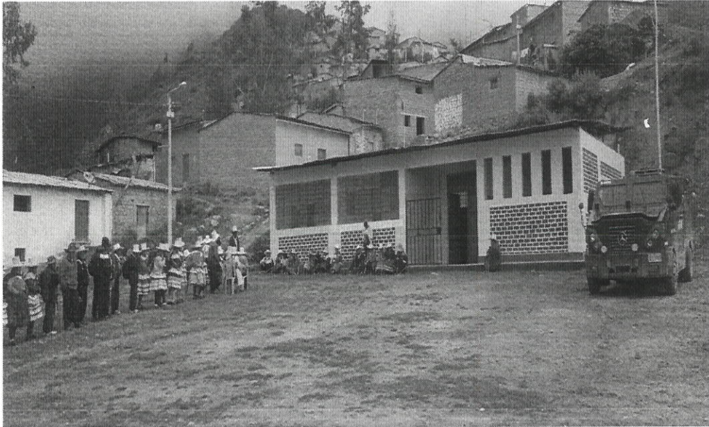
LLEGADA HERMES A CCPP CHACLANCAYO

"Decenio de la Igualdad de Oportunidades para Mujeres y Hombres" "Año de la unidad, la paz y el desarrollo"