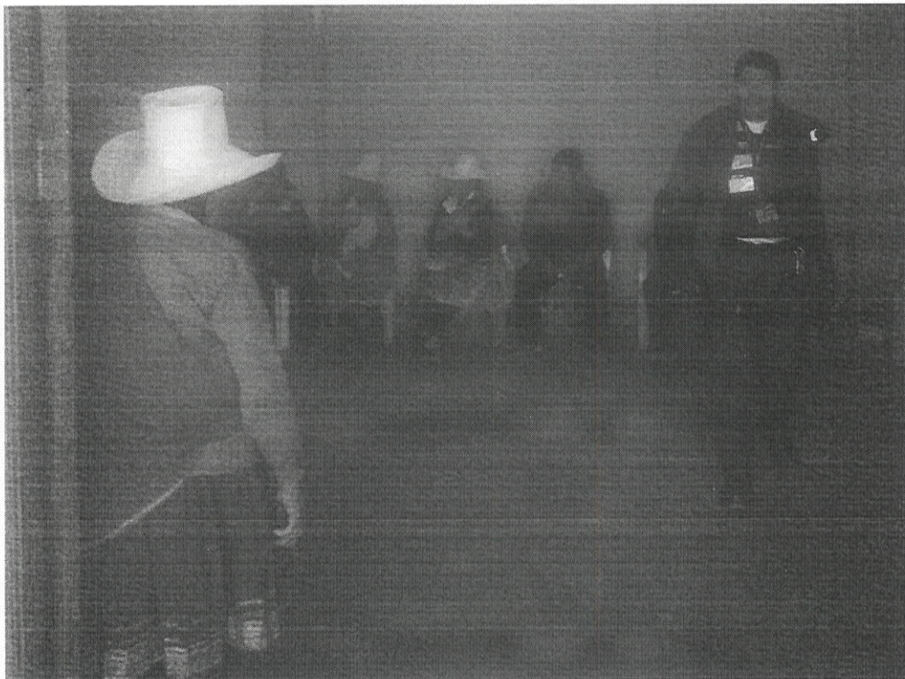
ATENCION EN CCPP CHACLANCAYO

Pioneros en Certificación Antisoborno ISO 37001 Certificación de todos sus procesos ISO 9001:2015