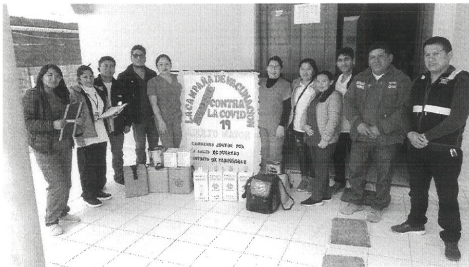
PANEL FOTOGRAFICO SECTOR SALUD Y SEGURIDAD CIUDADANA DEL DISTRITO DE PAMPAROMAS

Pioneros en Certificación Antisoborno ISO 37001 Certificación de todos sus procesos ISO 9001:2015