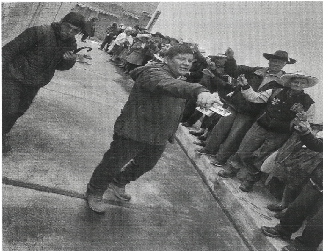
ORGANIZACIÓN DE LAS FILAS EN PUNTO DE PAGO PAMPAROMAS

Pioneros en Certificación Antisoborno ISO 37001 Certificación de todos sus procesos ISO 9001:2015