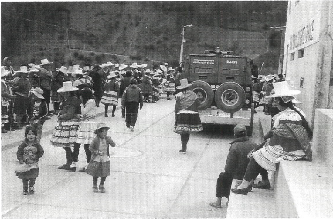
USUARIOS A LLEGADA DE ETV CCPP PISHA

"Decenio de la Igualdad de Oportunidades para Mujeres y Hombres" "Año de la unidad, la paz y el desarrollo"