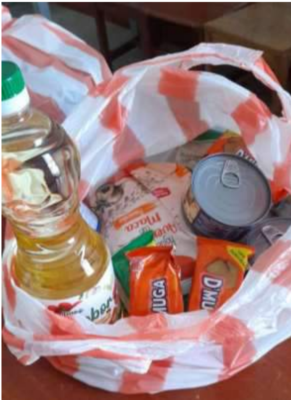
Ración a distribuir evitando el fraccionamiento.