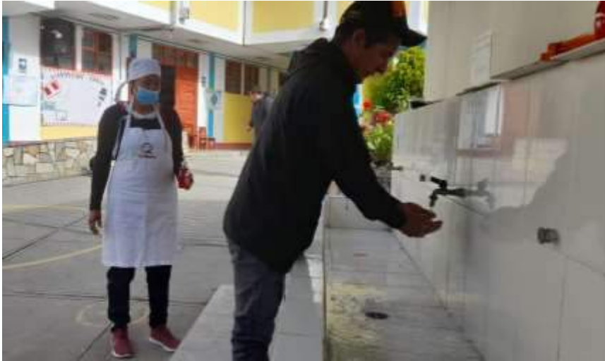
Lavado de manos