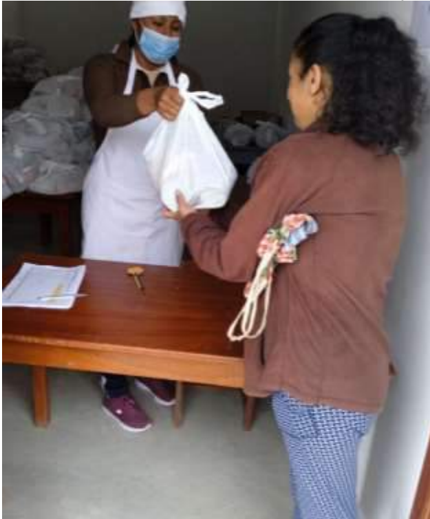
Entrega de Alimentos a las madres de familia.

"Decenio de la Igualdad de Oportunidades para Mujeres y Hombres" "Año de la unidad, la paz y el desarrollo"