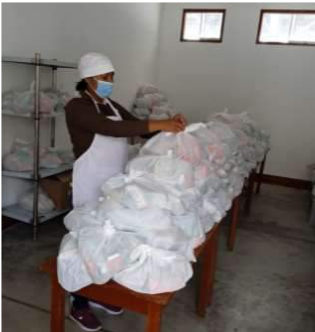
Armado de canastas