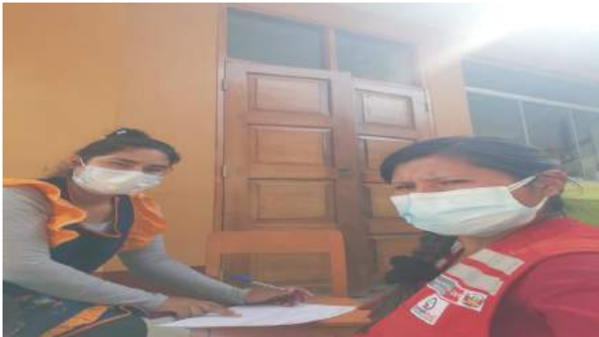
Anexo 07: Fotografía con los integrantes CAEs de la IE. 179 Santa Rosa brindando asistencia técnica.