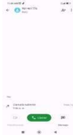
IMAGEN 04: Caso N° 0058-2023-CTVC/HVC