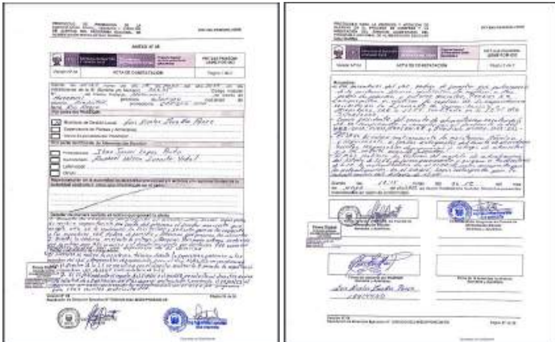
Fotografía 7. Acta de constatación de la IE 30635

Conclusión: Con fecha 13/03/2023 y 31/03/2023 el CAE recibió asistencia técnica / capacitación en relación a sus funciones, suscribiendo acuerdo para aplicación y cumplimiento. El caso se concluye FUNDADO.