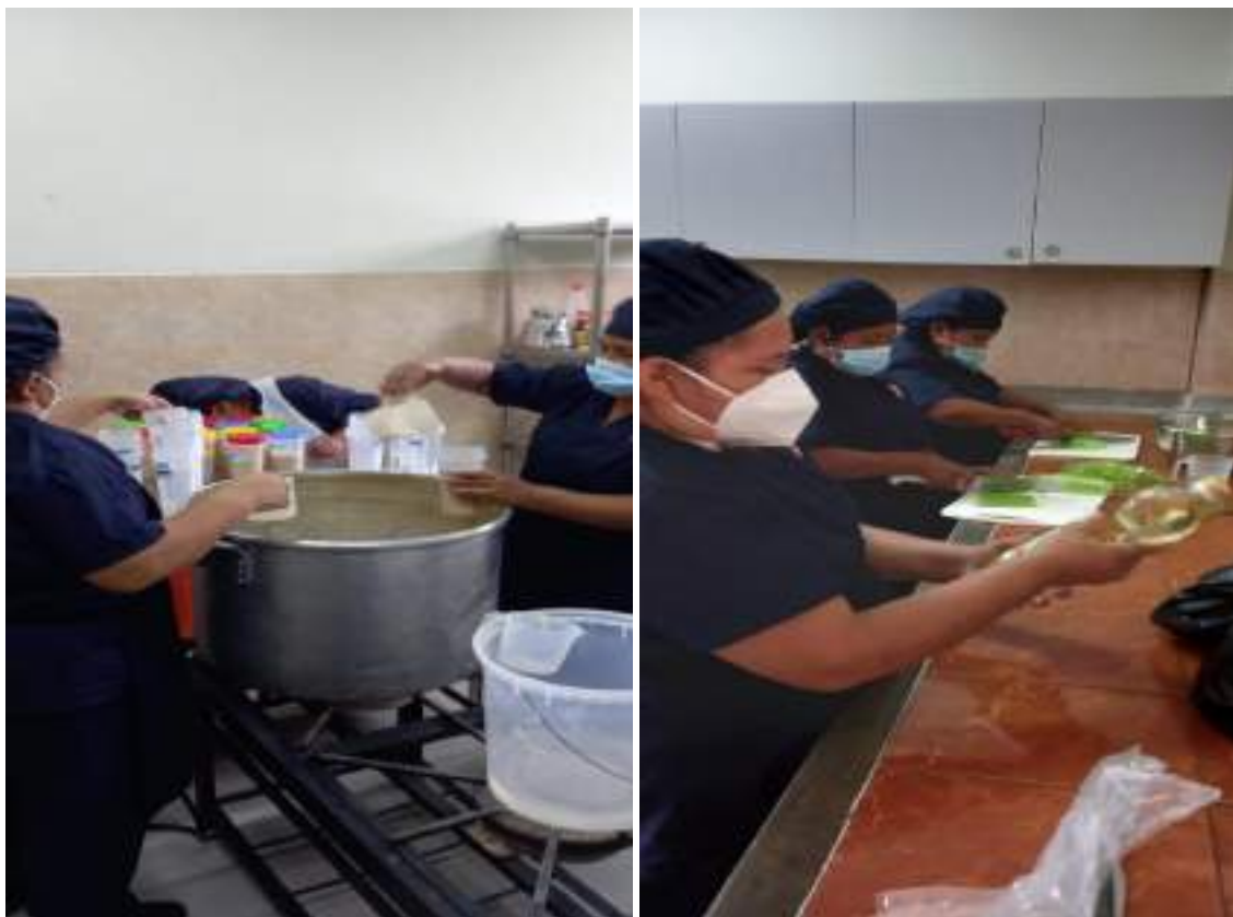
Fotografía 3. Asistencia técnica a responsables de cocina durante la prestación del servicio alimentario