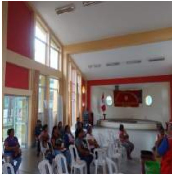
Fotografía 4. I Jornada de capacitación dirigido a los integrantes del comité de alimentación escolar –cae 2023 realizado en IE 30635.

"Decenio de la Igualdad de Oportunidades para Mujeres y Hombres" "Año de la unidad, la paz y el desarrollo"