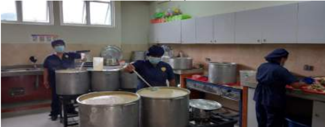
Fotografía 2. Acta de supervisión programado el 13/03/2023

"Decenio de la Igualdad de Oportunidades para Mujeres y Hombres" "Año de la unidad, la paz y el desarrollo"