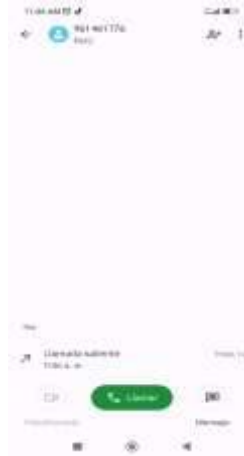
IMAGEN 04: Caso N° 0058-2023-CTVC/HVC