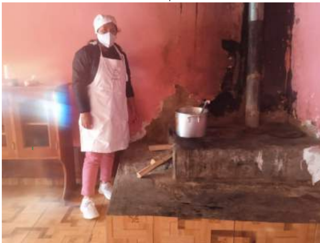
Foto de la encargada de la preparando los alimentos usando las indumentarias limpias y completos.