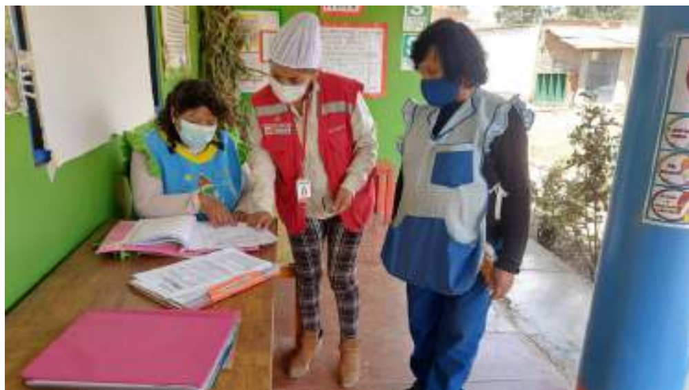
IMAGEN N° 1: Asistencia técnica a los integrantes CAE