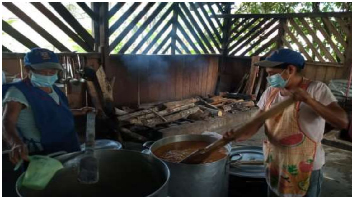
Anexo N° 11 Fotografías de servicio alimentario cumplimiento de CAE respecto a indumentaria y BPM.- Servido y Distribución.