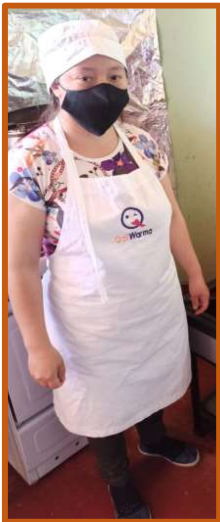
Anexo N° 06: Fotografía del CAE con indumentaria completa