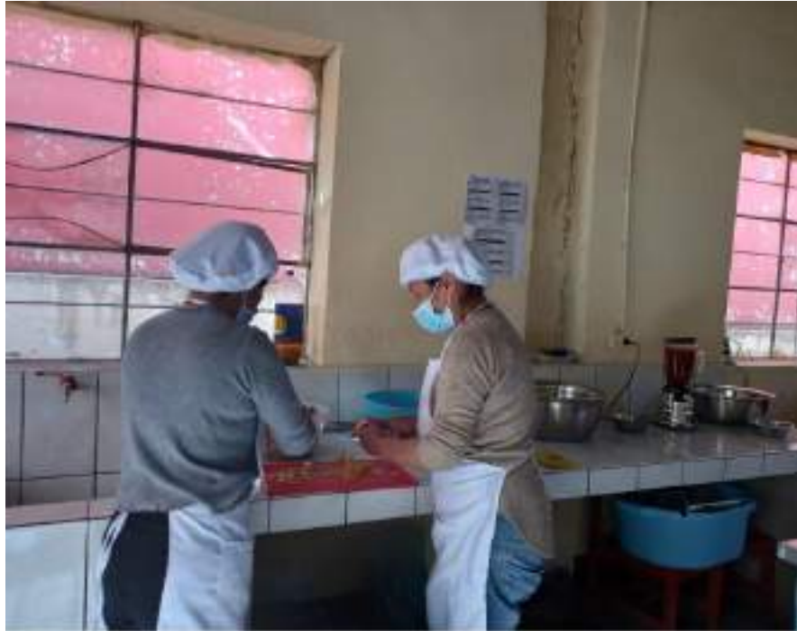
IMAGEN N°01: fotografía durante la preparación de alimentos en la IE N° 54195 NUESTRA SEÑORA DEL CARMEN en fecha 22.05.2023.

Respecto al punto crítico 3 el CAE se compromete a hacer cumplir que el personal que prepara los alimentos utilice la indumentaria limpia y completa, además de que cumplan con las buenas prácticas de manipulación, higiene y preparación balanceada.