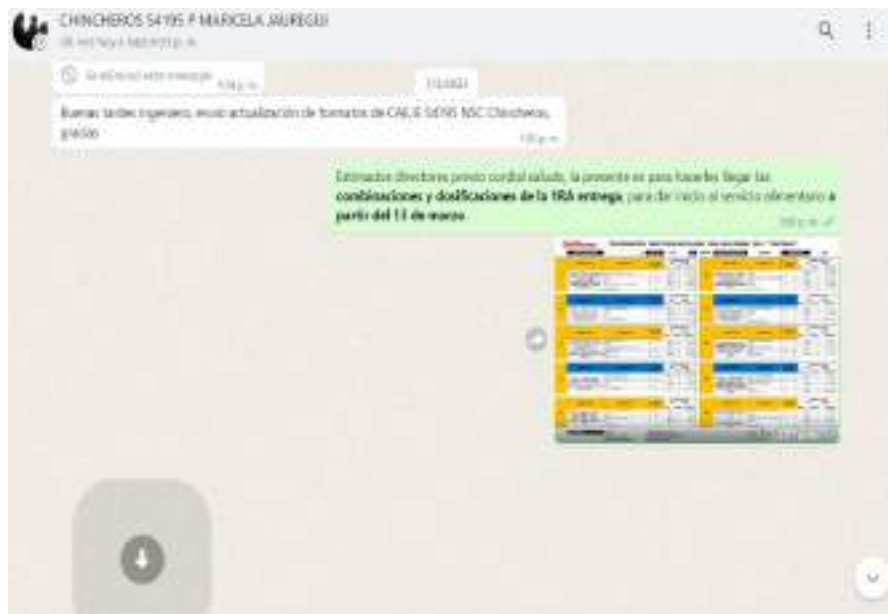
IMAGEN N°02: Captura de pantalla del envío de las combinaciones y dosificaciones, correspondiente a la 1ra entrega .

Al respecto, en fecha 07.03.2023, se envía a la presidente del CAE las combinaciones y dosificaciones a usar para la distribución de productos, correspondiente a la primera entrega.