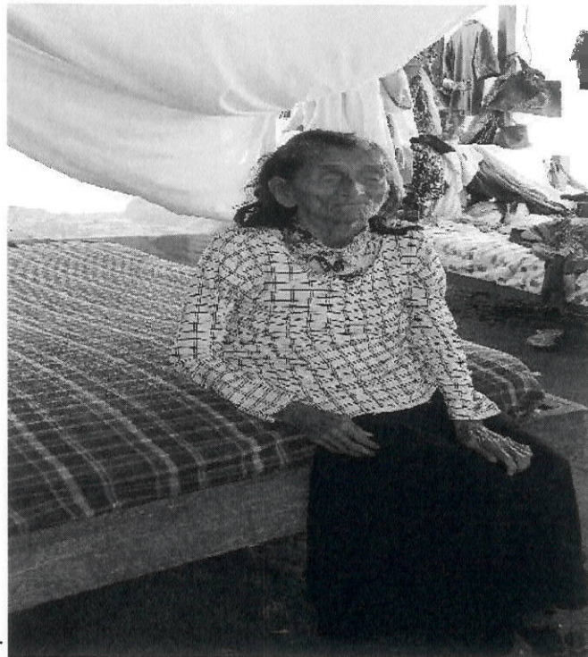
Dormitorio de Adulto Mayor

Pioneros en Certificación Antisoborno ISO 37001 Certificación de todos sus procesos ISO 9001:2015