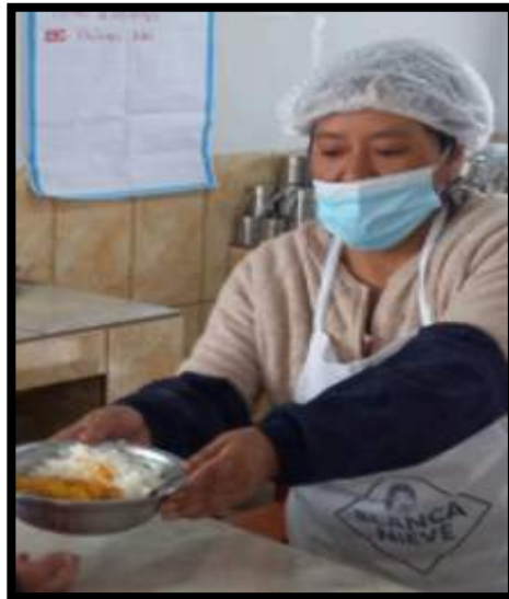
Imagen 9. La distribución y traslado de los alimentos se realiza con la indumentaria completa.

Conclusión: Con fecha 24/03/2023 se realiza la constatación del punto crítico alertado encontrando que los estudiantes que realizan la distribución de los alimentos no usan la indumentaria correspondientes por motivos no se cuenta con la indumentaria adecuada, tomando acciones correctivas respectivas se logros brindar asistencia técnica al CAE para el cumplimiento del uso de las indumentarias adecuadas, El caso se concluye FUNDADO.