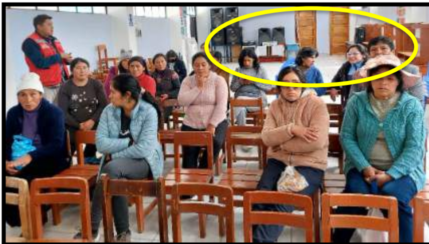
Imagen 4. Asistencia técnica dirigió al CAE sobre las combinaciones propuesta por el programa.