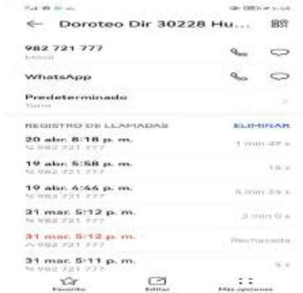
Imagen N° 02: Captura de pantalla de comunicación telefónica con presidente del CAE.

Con fecha 21/04/2022 se realiza el seguimiento de los compromisos del CAE en referencia a la mitigación del punto alertado encontrando lo siguiente: