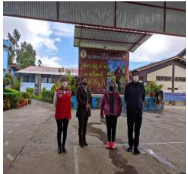
Taller de capacitación al Comité de alimentación escolar