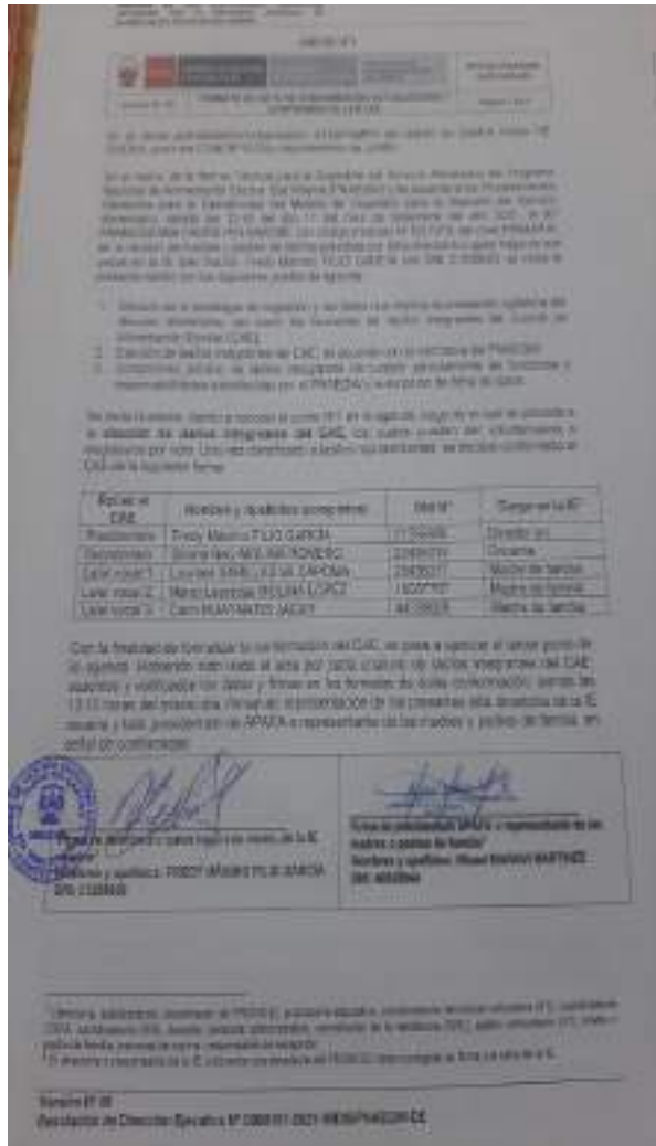
Acta conformada del CAE 17/09/2021

De la misma manera mencionar que el CAE de la Institución Educativa se actualizo el día 24/03/2022 teniendo nuevos integrantes. También mencionar que la asistencia remota se ha realizado de manera fluida con algunos de los integrantes del CAE de la institución educativa.