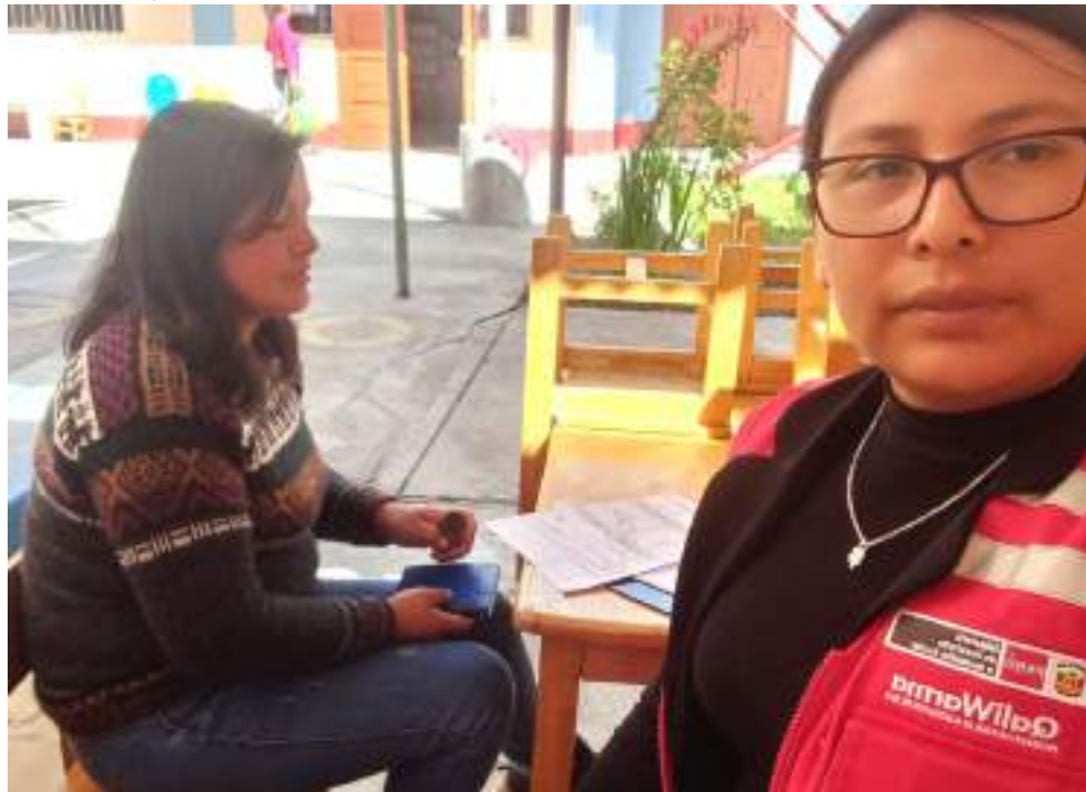
Imagen 02: Asistencia técnica sobre el proceso de actualización RDE 259-2022-MIDIS/PNAEQW

"Decenio de la Igualdad de Oportunidades para Mujeres y Hombres" "Año de la unidad, la paz y el desarrollo"