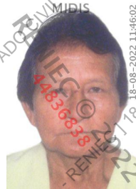
Foto del Ciudadano