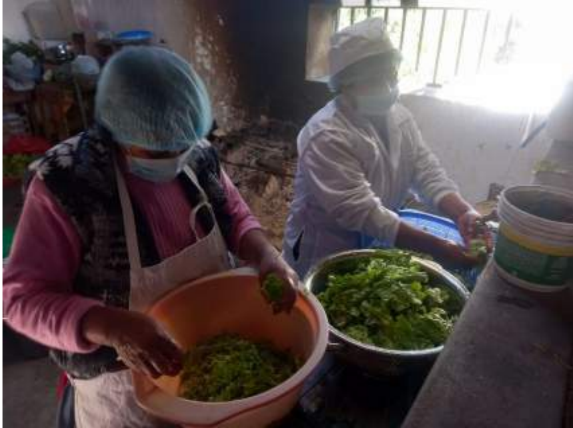
Anexo 6: persona que prepara los alimentos con la indumentaria completo