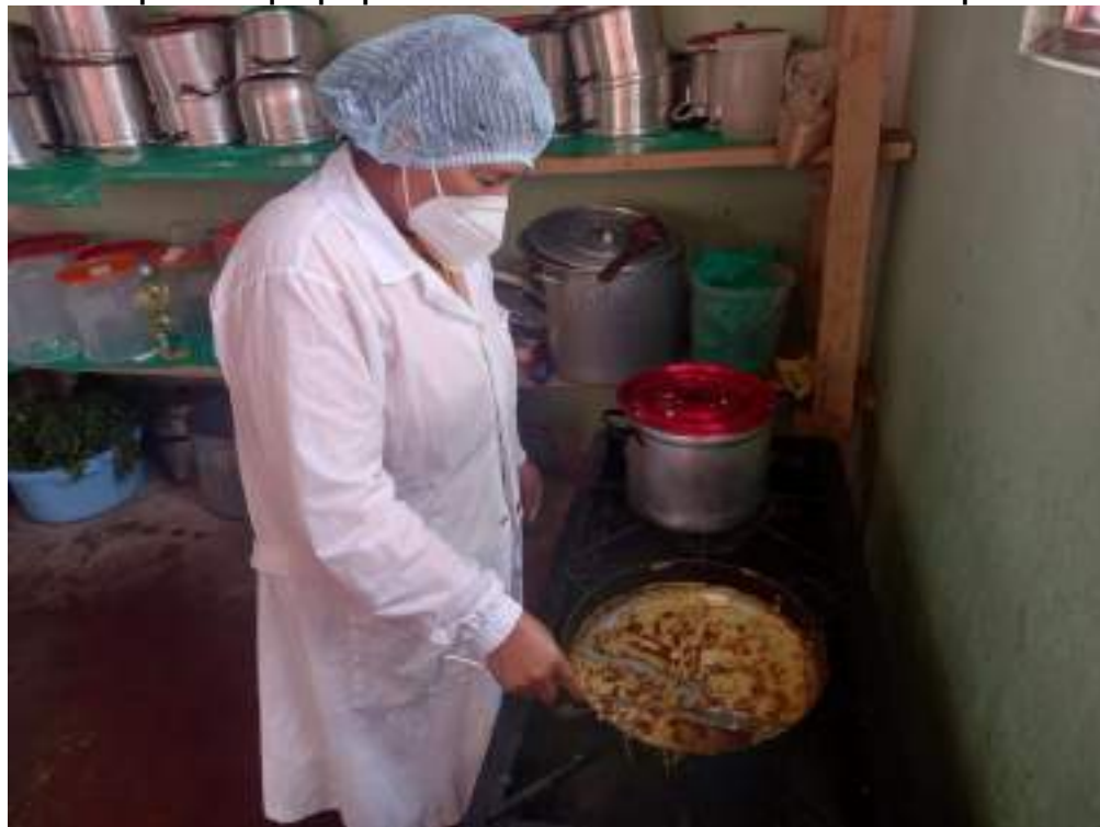
Anexo 7: persona que prepara los alimentos con la indumentaria completo