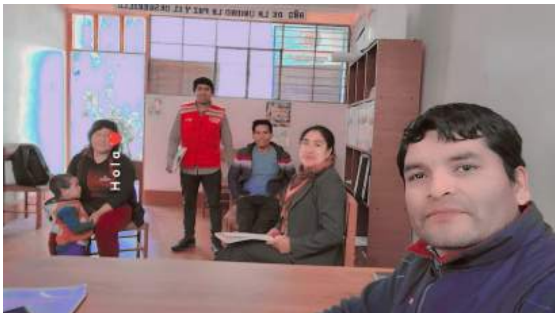
Anexo 06: Registro fotográfico de la capacitación centralizada a integrantes del CAE