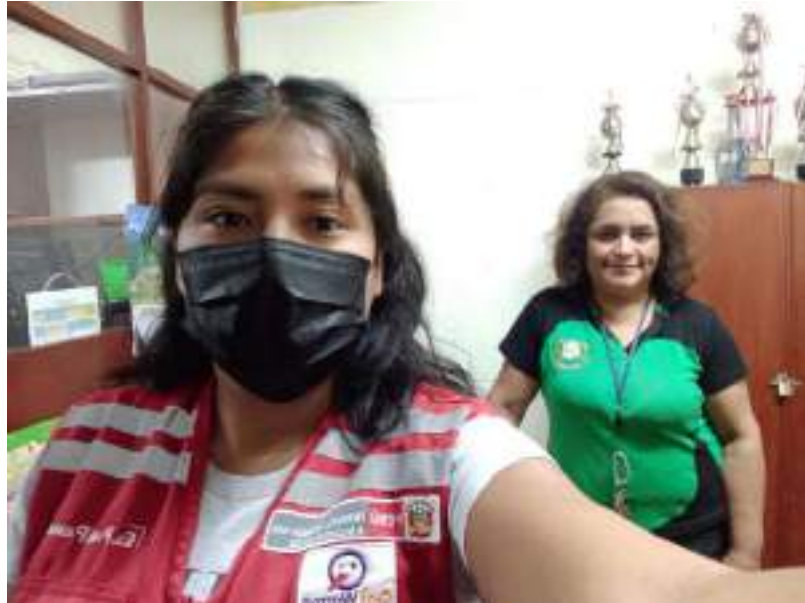
Se adjunta foto de la Asistencia tecnica a la directora.