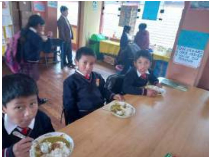
Consumo del almuerzo