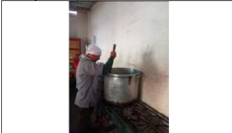
Preparación del almuerzo

Vistas fotográficas de la prestación del servicio alimentario 22/05/2023