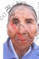
Foto del Ciudadano