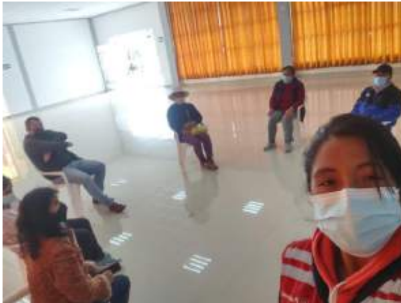
Imagen N° 4 capacitación centralizada a CAEs

Conclusión: Con fecha 03/05/2022 se realiza la constatación del punto alertado encontrando que la distribución de los alimentos correspondiente a la PRIMERA ENTREGA se realizó en la fecha 18/03/2022, tomando acciones correctivas para cumplimiento de la distribución antes de periodo de atención. El caso se concluye FUNDADO.