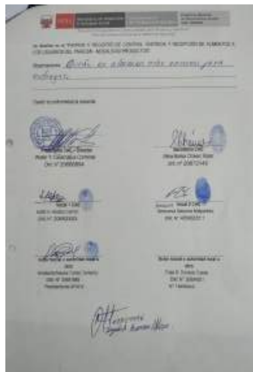
Imagen 1. Acta de distribución de alimentos.