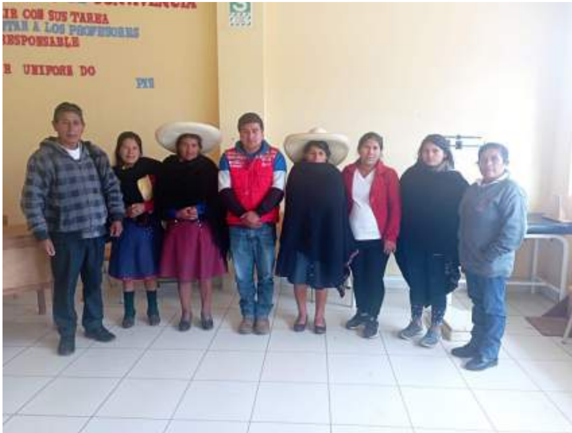
Asistencia técnica a profesores tutores y coordinadores

Anexos. - Capacitación a integrantes CAE realizado el 11 de abril del 2023